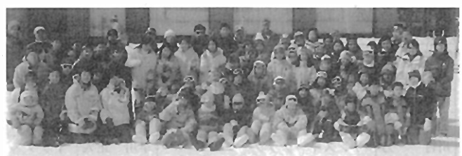
春休みファミリースクール (2005. 3. 31)