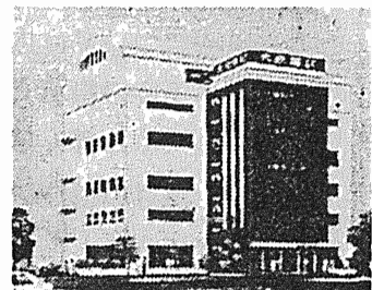
体育館のある本館

大阪校・横浜校・名古屋校・浜松校・静岡校 (東京校) 〒101 東京都千代田区西神田2-4-11 仙台校・福岡校・札幌校・金沢校 ☎03(237)8711