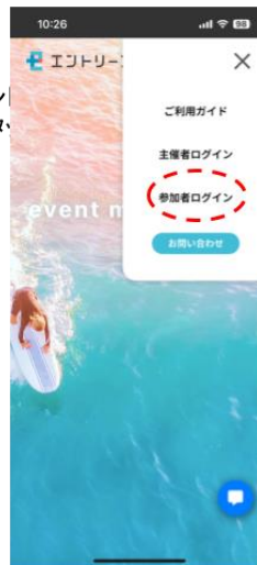
スマートフォンの場合

エントリープラスLINE公式アカウント 「メニューを開く」から「LOGIN」をタ