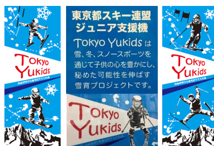
都連事務局に設置している自動販売機のデザインです。